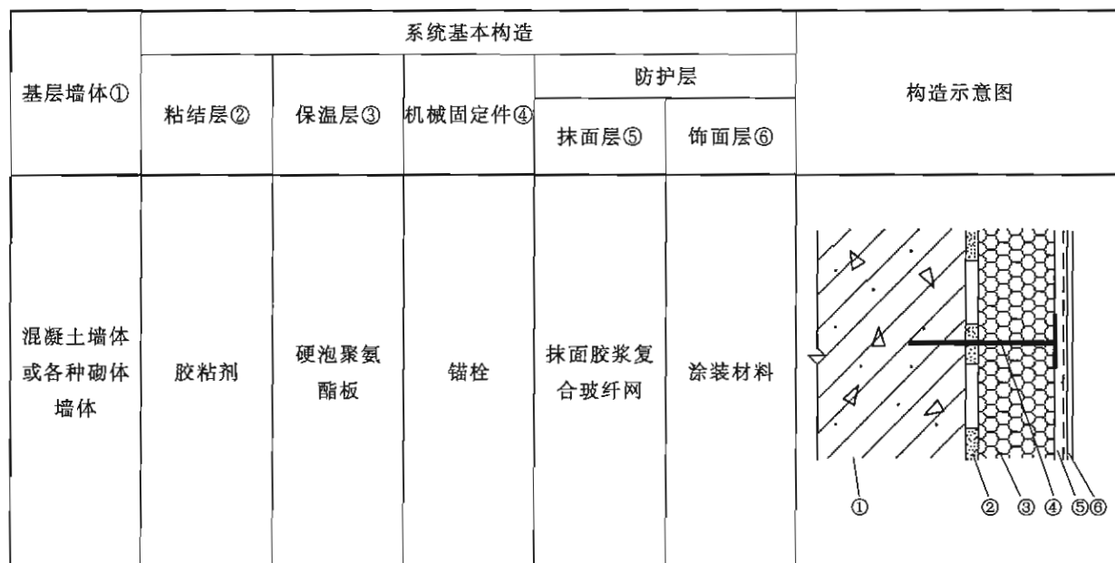
表 1 硬泡聚氨酯板外保温系统基本构造

4.2 硬泡聚氨酯板外保温系统的各种组成材料应配套供应。所采用的所有配件,应与硬泡聚氨酯板外保温系统性能相容,并应符合国家现行相关标准的要求。